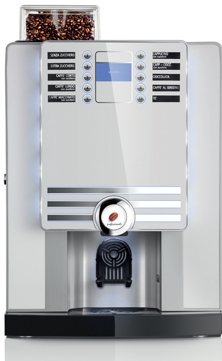
xs grande professionale vho