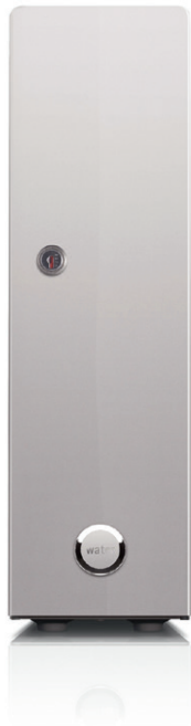
modul on water