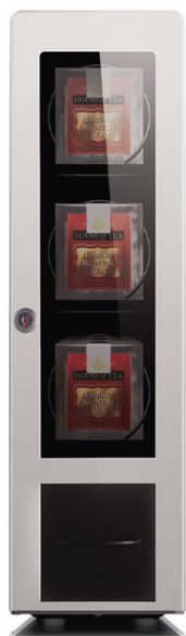
modul on dispenser

Модуль для чайных пакетиков 3 отделения для чайных пакетиков