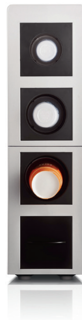
modul on cups

Совместим с eC professionale, xs grande professionale, xs grande professionale vho