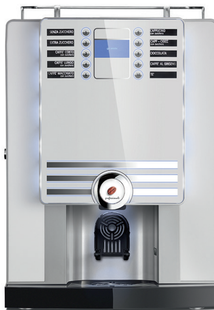
xs grande professionale